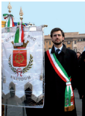
In rappresentanza del mio Comune, a una celebrazione del 25 Aprile a Milano

Se risiedi a Milano, o in un comune della provincia, mi puoi votare.