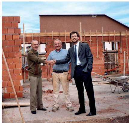
In sopralluogo con i volontari per verificare i lavori di costruzione di un nuovo Centro Anziani.

Se risiedi a Milano, o in un comune della provincia, mi puoi votare.